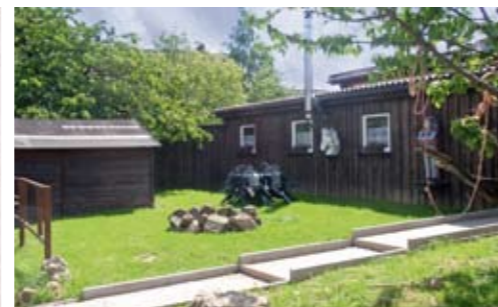
Die Seminare im Reiterstübchen vermitteln allerlei Wissenswertes rund ums Pferd.