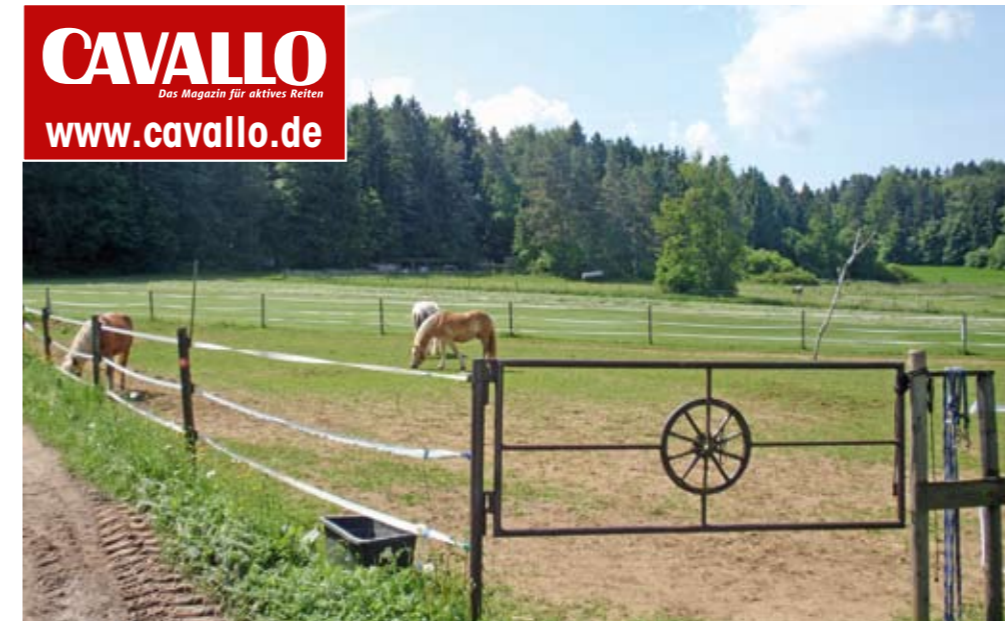
Auch Haflinger und Tinker gehören zu den Schulpferden auf der Stormy Horse Ranch.