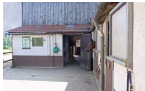
Alle Pferde stehen in hellen, luftigen Außenboxen, einige sogar in Paddockboxen.