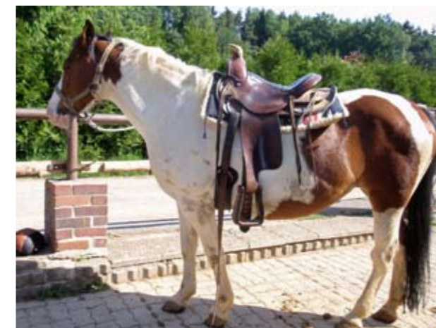
Schulpferd Shakira hat vorne links einen starken Bockhuf. Ihr Vorbesitzer hatte sich darum zu wenig gekümmert.